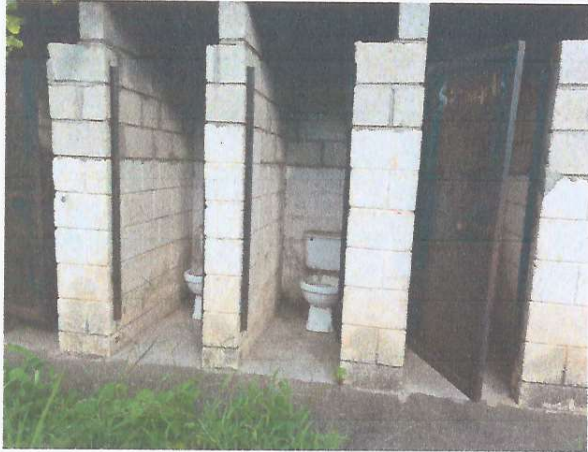
Foto1: REPARACION DE BAÑOS